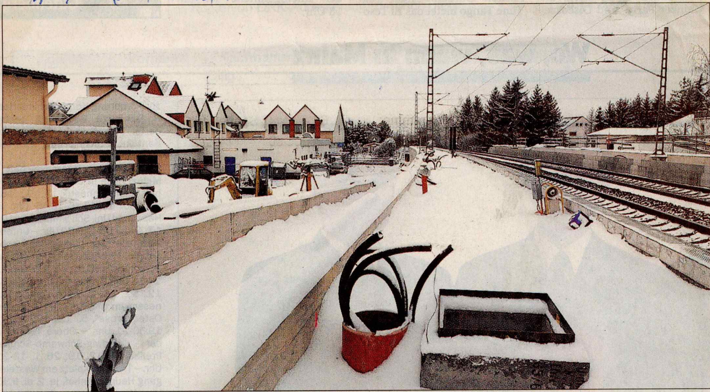
Der neue Bahnhofpunkt, der im Frühjahr fertig sein soll, liegt mitten in der Gemeinde.